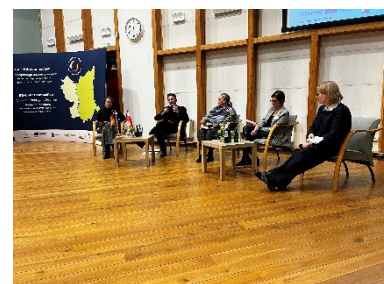
Diskussionspanel zur grenzüberschreitenden Daseinsvorsorge mit lokalen Stakeholdern und Expert:innen bei der Halbzeitkonferenz des Interreg-Projekts