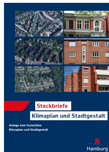
Erläuterungen zur stadtbildprägenden Bausubstanz mittels Luftbildern und Fotos