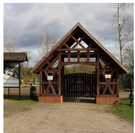
Streicheltierhof als eine der Anker Nutzungen im Hainholz