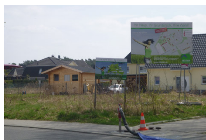
Schulstandort und Wohnbauflächen in der Gemeinde Stahnsdorf