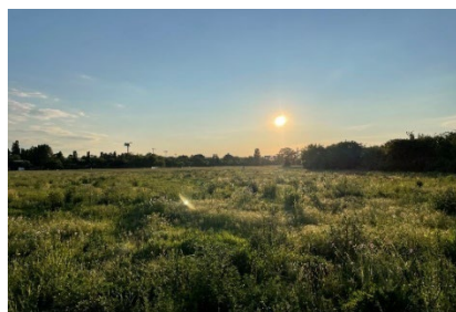
Wildbewachsenes Feld im Untersuchungsgebiet, David Seitz, complan (2024)