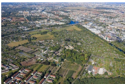
Luftbild des Untersuchungsgebiets, Dirik Lauber, SenStadt (2024)