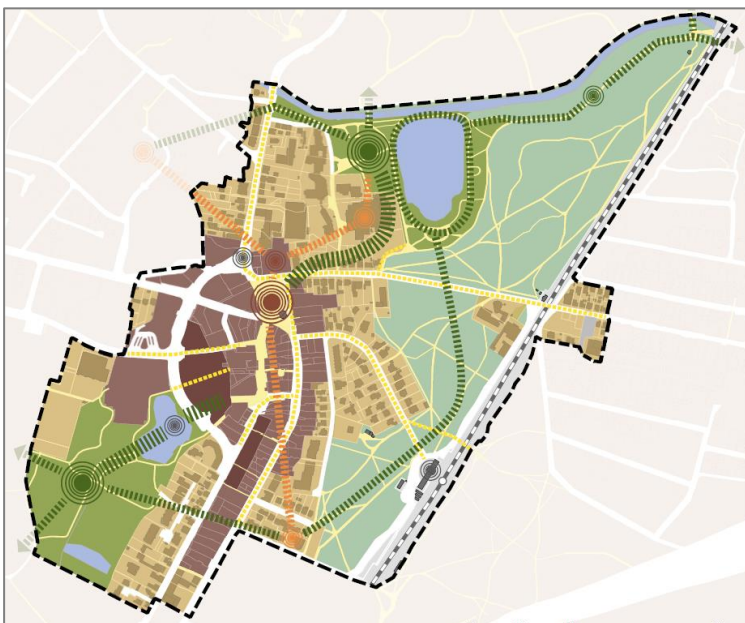
Räumliches Leitbild für die Innenstadt Bad Schwartaus

Die Aufnahme des Untersuchungsbereichs Innenstadt Bad Schwartau in das Bund-Länder-Programm Lebendige Zentren der Städtebauförderung stellte eine Anerkennung dieser Handlungsbedarfe dar. Mit der Einleitung vorbereitender Untersuchungen (VU) nach § 141 des Baugesetzbuchs (BauGB) für das Gebiet sind erste Weichen hin zu einer städtebaulichen Gesamtmaßnahme gestellt.