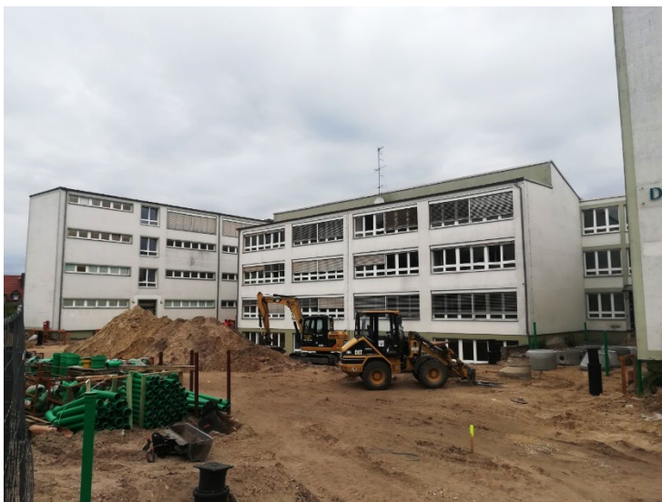
Erweiterung eines Grundschulstandortes